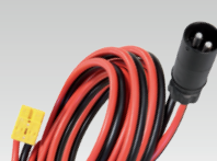
Андерсон/HATO 2.5 m - 16 mm 2 026810