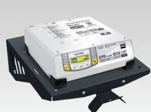
Полка с настенным креплением 055513