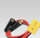
Андерсон<->Техас 0.2 m - 16 mm 2 055902 1 m - 16 mm 2 028791