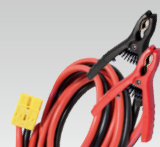
Андерсон/Зажимы 2.5 m - 16 mm 2 056503 5 m - 16 mm 2 054615 8 m - 16 mm 2 056572