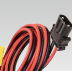
Андерсон/Рема 160 А 5 m - 16 mm 2 069091