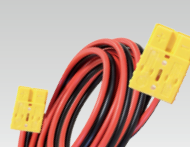
Андерсон/Андерсон 175 А 5 m - 16 mm 2 069107